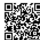
Ficha de datos de seguridad (SDS)